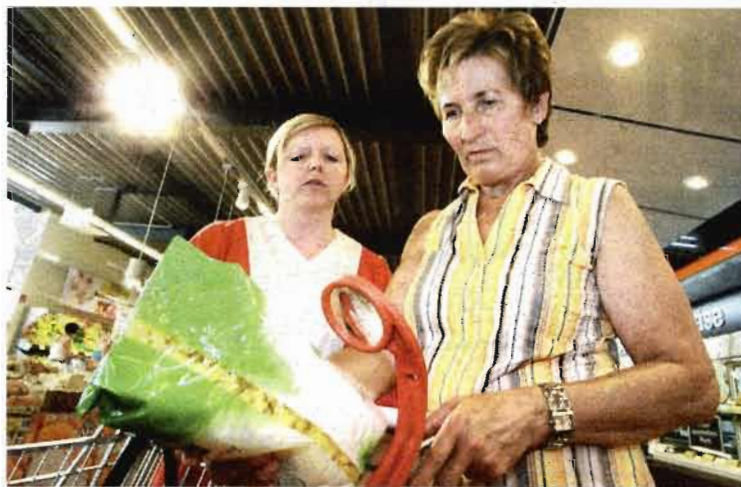
Die Lupe macht die kleingedruckten Produktinfos wieder lesbar

Das Ergebnis: Der nagelneue Spar-Markt in der St.-Peter-